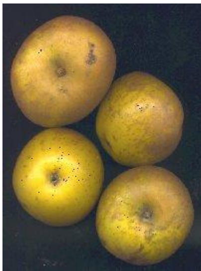
vues CHOISEL jean-Louis© 2000-